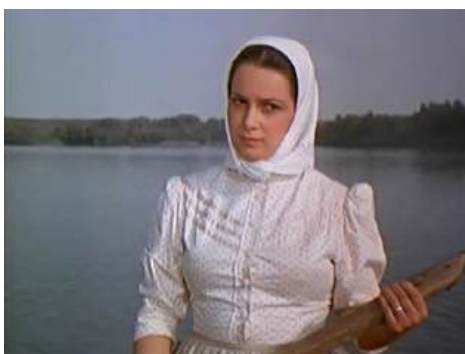
Рис. 2 № кадров _____