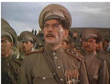
Рис.1 №№ кадров _____